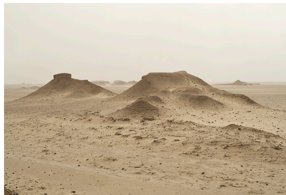
Abdessamad El Montassir, Al Amakine (paysage) © Abdessamad El Montassir / ADAGP, Paris

La collection, conservée dans les vastes réserves du Frac, est riche de plus de 700 œuvres d'artistes français et étrangers. Cette collection illustre la richesse de la création actuelle et la diversité des formes de l'art contemporain : peintures, sculptures, dessins, photographies, vidéos, installations, performances... et s'inscrit en résonance avec le passé horloger franc-comtois en questionnant la notion de temps. Elle s'enrichit chaque année de nouvelles acquisitions, sélectionnées par un collège d'experts qui veillent à ce qu'y soient représentées les notions de temporalité et de transdisciplinarité, notamment à travers des œuvres sonores ou dialoguant avec le spectacle vivant.