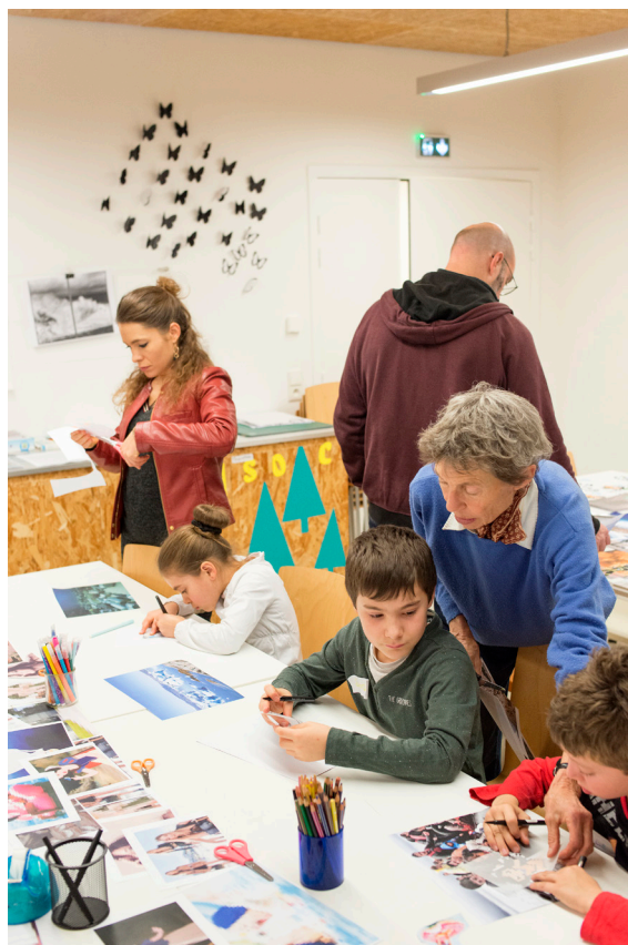
Visite-atelier parents-enfants, 2019, Frac Franche-Comté.