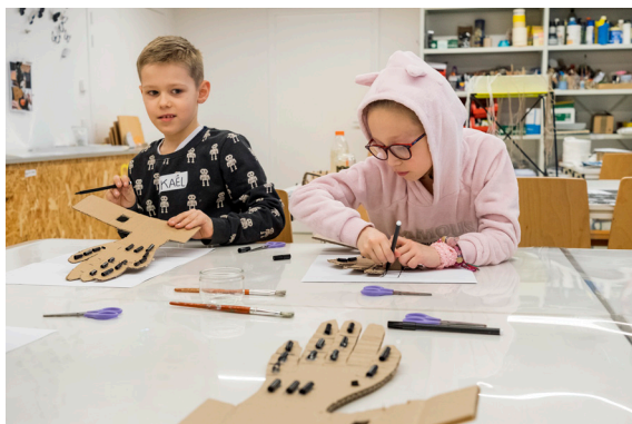
Atelier 7-12 ans, 2020, Frac Franche-Comté.