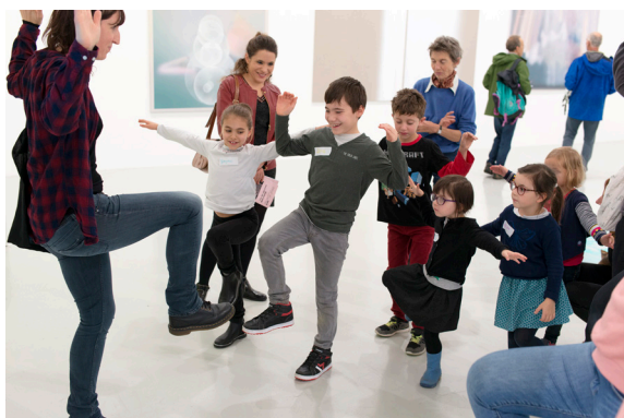
Visite-atelier parents-enfants, 2019, Frac Franche-Comté.