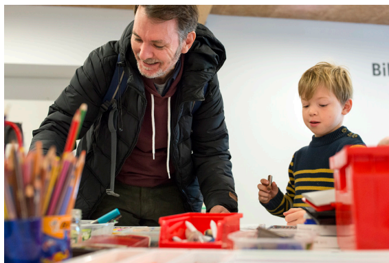
WE FRAC, 2019, Frac Franche-Comté.