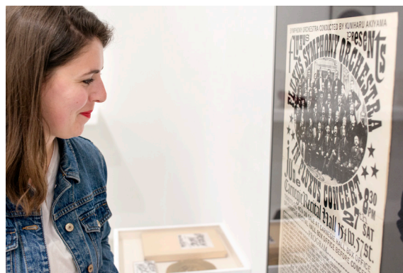
Visite de l'exposition Vinyls @ Clips, 2019, Frac Franche-Comté.