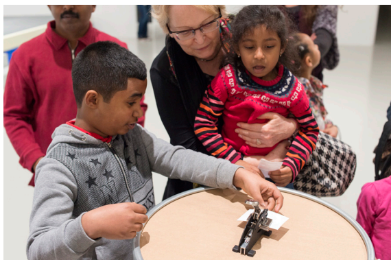
Visite-atelier parents-enfants, 2019, Frac Franche-Comté.